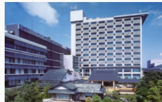
会場 グランディア芳泉 全景